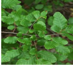
Roble pellín (Nothofagus obliqua)