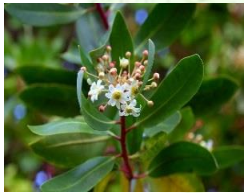
Canelo (Drimys winteri)