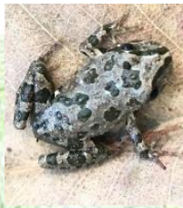
Sapito de 4 ojos (Pleurodema thaul)