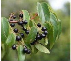
Maqui (Aristotelia chilensis)