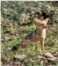
Zorro culpeo (Lycalopex culpaeus)